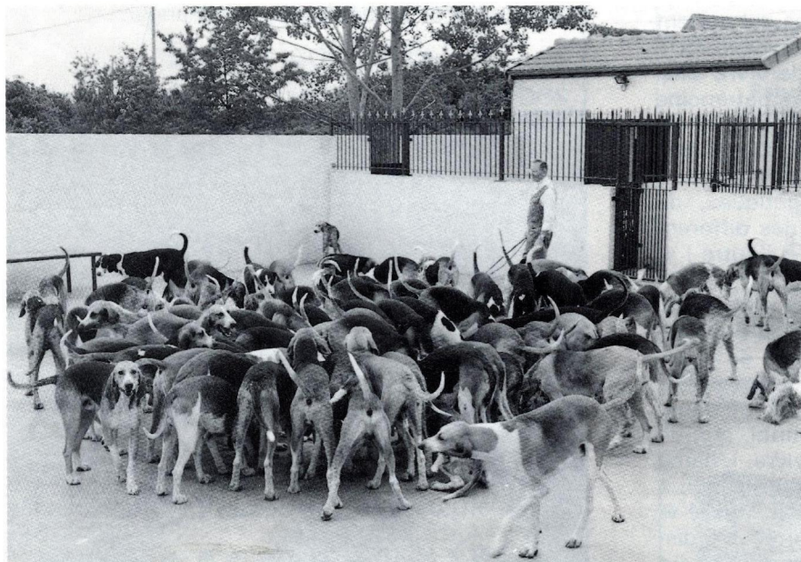
Au chenil de Banassat : les meutes du Vautrait de Banassat et du Rallye du Bousquet.

Le chenil héberge maintenant deux meutes : depuis de nombreuses saisons celle du Rallye du Bousquet, soixante Anglo-Français tricolores créancés sur le chevreuil, et celle du Vautrait de